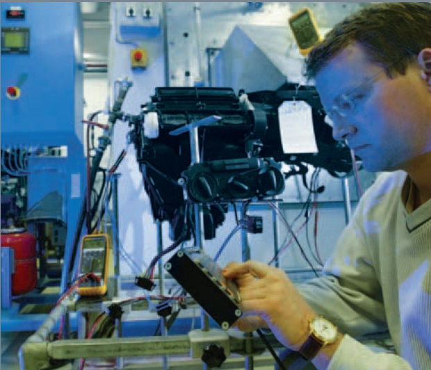
Klimaprüfstand zur Untersuchung des Regelverhaltens der Heiz-Klimageräte