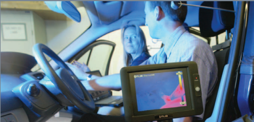
Erprobung eines Fahrzeugklimatisierungssystems im Fahrzeug

Die IAV verfügt über verschiedene Klimakammern. Hier können Scheibenenteisungs- und Entfeuchtungsversuche (siehe Abbildung oben) sowohl nach der europäischen Norm EWG 78/317 als auch nach der nordamerikanischen Norm FMVSS Nr.103 durchgeführt werden. Darüber hinaus sind Aufheiz- und Abkühlmessungen im Temperaturbereich zwischen -40\text{ °C} und +50\text{ °C} möglich. Die Klimalagerung von Bauteilen zwischen -40\text{ °C} und +130\text{ °C} ist ein weiteres zweckmäßiges Anwendungsfeld der bewährten Klimakammern.