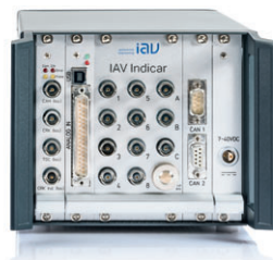
IAV Meru Indiziersystem

IAV Kivu ist ein flexibles, vielseitig konfigurierbares Steuergerät für die Entwicklung neuer Brennverfahren und Einspritzkomponenten.