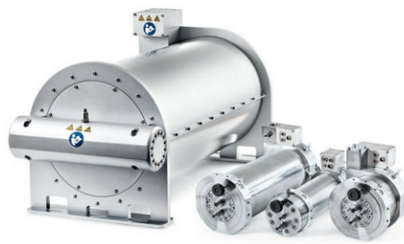
IAV Cross Injection Analyzer

IAV Dragon verbindet Fahrzeuge mit dem Internet der Dinge und modernen Fahrerassistenzsystemen. Es ist ein skalierbares Steuergerät für Prototypen und Kleinserien im Pkw- und Nfz-Bereich.