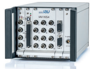
IAV Meru Indiziersystem mit Klopfkennung

in der aktuell verfügbaren Generation als IAV Indicar IAV Indicar ist ein Messinstrument zur Berechnung, Anzeige und Auswertung thermodynamischer Größen von Verbrennungsmotoren.