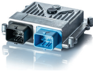
IAV Dragon Universalsteuergerät

Sie möchten mit uns zu unseren Produktlösungen in Kontakt treten? Dann senden Sie Ihre Anfrage oder dieses Formular an: engineering-tools@iav.com