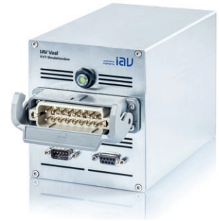
IAV Vaal Simulationssystem für Ventiltriebe

IAV Cross ist ein leistungsstarkes System zur hydraulischen Vermessung von Einspritzventilen. Es kommt zum Einsatz, wenn differenzierte Betrachtungen von Einspritzvorgängen gefragt sind.