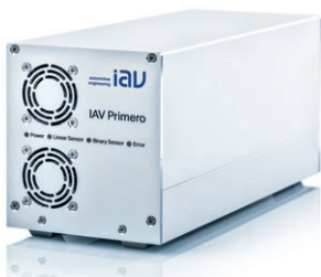
IAV Primero Fehlersimulation für Lambdasonden

in der aktuell verfügbaren Generation als IAV KIS4 IAV KIS4 ist ein Messinstrument zur Berechnung, Anzeige und Auswertung thermodynamischer und klopfspezifischer Größen von Verbrennungsmotoren.