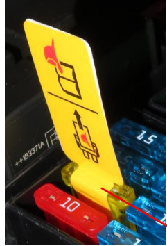
Bild ist nicht korrekt, Sicherung muss 7,5A sein

Warnaufkleber 12E.010.867.Q an Sicherung SR7/3 ( 7,5A ) anbringen